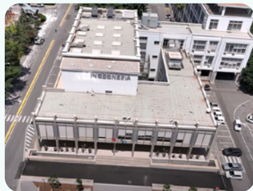
Aula Giuseppe Capito Dipartimento di Ingegneria, Viale delle Scienze, ed. 7 Palermo