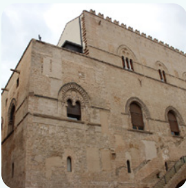
Complesso Monumentale dello Steri Aula Magna Piazza Marina, 60 Palermo